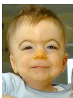
Cornelia deLange (Brachman-deLange)

Cara redonda Fisuras palpebrales inclinadas hacia abajo Pico de la viuda Orejas “colgantes” prominentes Contractura específica de los dedos en extensión Heredado ligado-X Defecto molecular identificado