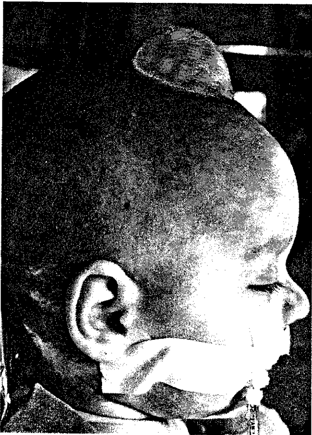
Fig. 1. Tumoración semiesférica situada en fontanela anterior, cubierta de cuero cabelludo normal y de contenido líquido demostrable por transluminación.

Las características fundamentales de los QD epicraneales son: localización en fontanelas, ausencia de comunicación con los planos subyacentes y contenido líquido (10). Suelen ser asintomáticos neuroló-